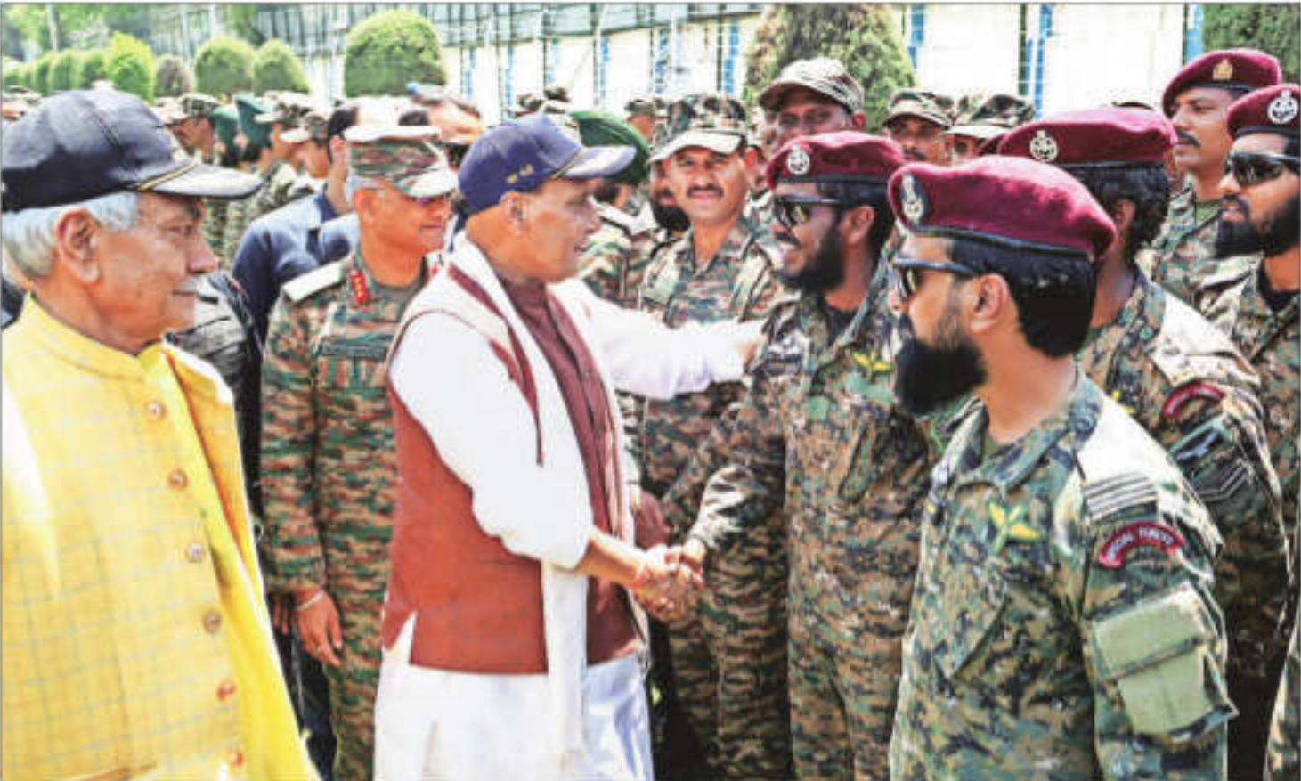
Defence minister Rajnath Singh meets troops during a visit to the Badami Bagh Cantonment in Srinagar along with J&K Lt Governor Manoj Sinha on Thursday

“The whole world has seen how irresponsibly Pakistan gave nuclear threats to India