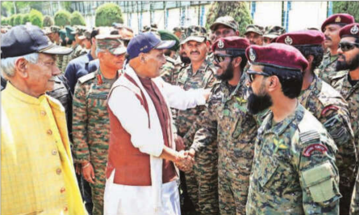
Defence minister Rajnath Singh meets troops during a visit to the Badami Bagh Cantonment in Srinagar along with J&K Lt Governor Manoj Sinha on Thursday

“The whole world has seen how irresponsibly Pakistan gave nuclear threats to India